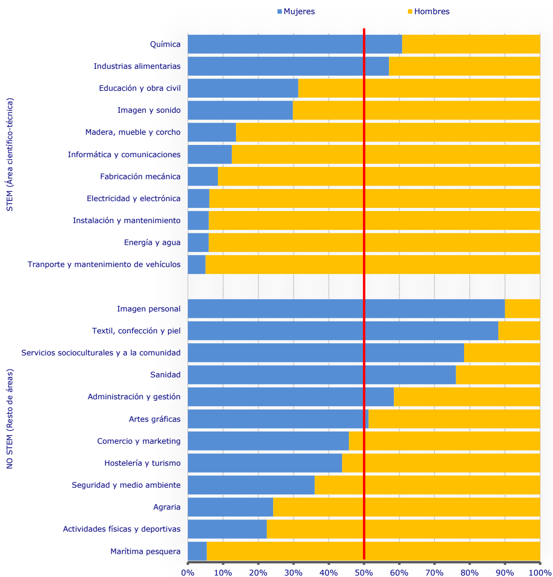
Alumnado matriculado en Formación Profesional de grado medio y superior en la C.A. de Euskadi por familias y sexo (%). Curso 2021/22