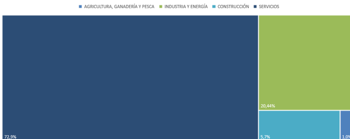
VAB por sectores de actividad. Bizkaia. 2022

En cuanto a la distribución de la actividad económica por sectores, Bizkaia mantiene una estructura muy similar a la media de la C.A. de Euskadi, donde el sector Servicios, motor de su economía, con el 72,9% del total de su VAB, se sitúa 3,4 puntos porcentuales por encima de la media de la Comunidad Autónoma. El sector de Industria y energía alcanza también un 20,4% de la actividad económica en el Territorio Histórico, quedándose algo por debajo del promedio de la C.A. de Euskadi (24,2%).